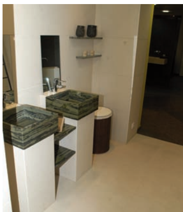
Vues du showroom de la marbrerie Le Gal, qui met en scène des sols et des aménagements de cuisine et de salles de bains, dans des matériaux très décoratifs.